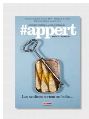
#APPERT N° 1